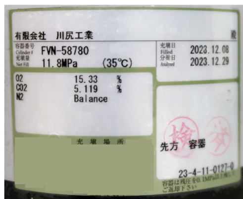
▲ 精密に混合されている証 ボンベ毎に貼られています