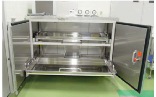
▲横型遺体保管冷蔵庫 写真は二体用