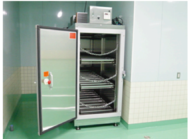
▲縦型遺体保管冷蔵庫（棺保管型） 写真は三体用