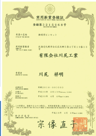
根拠に基づいて登録された証