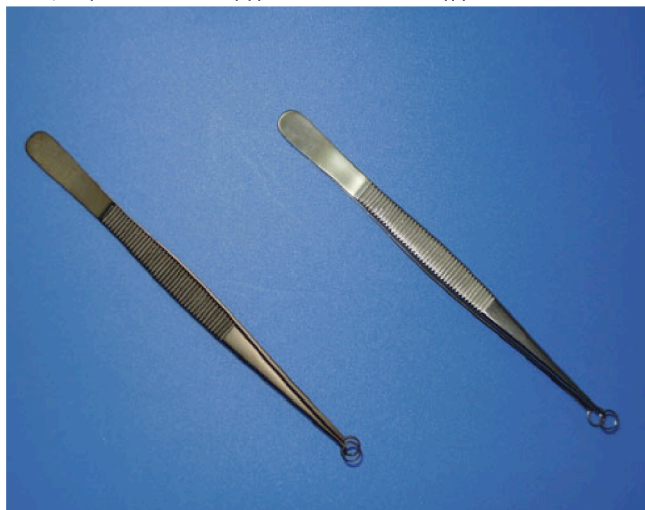
黒色ピンセットと通常のリングピンセット

形状や大きさは似ていて、同等品申請などで価格競争で粗悪品を販売する業者がおりますが、 材質や機能に同等品は存在なく価格競争ができるものではありません。実用新案は物真似ではない証拠