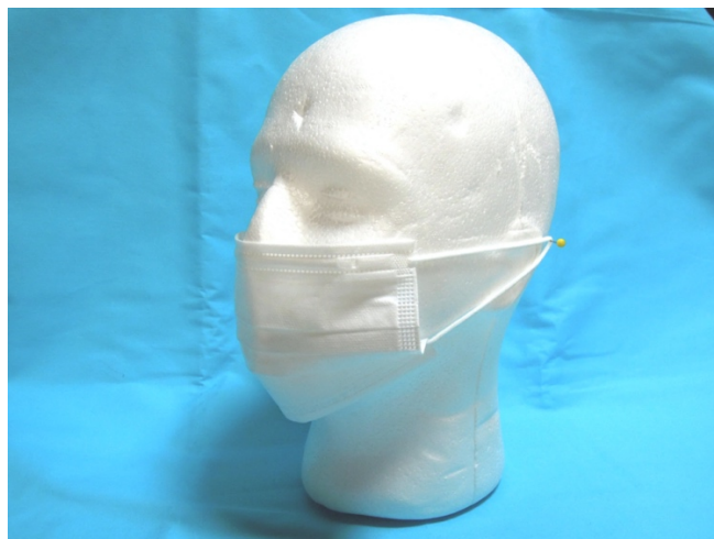
従来品サージカルマスク