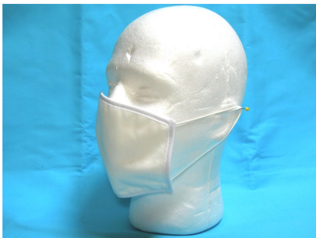
布製マスク（生地は抗菌ネル）