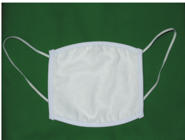
布製マスク（生地は抗菌ネル）